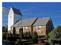
Nørre Omme Kirke